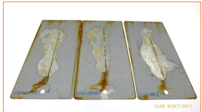
(b) Aspecto general del conjunto de muestras, detalle zona de incisión después de delaminación, una vez finalizado el ensayo.