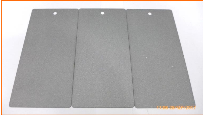
(a) Aspecto general del conjunto de muestras (estado de recepción en laboratorio).