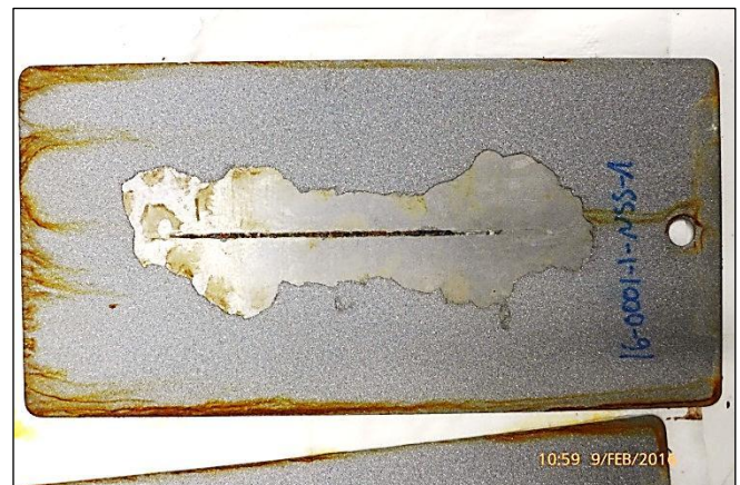
(b) Probeta "16-0001-1-31", detalle zona de incisión después de delaminación, una vez finalizado el ensayo.