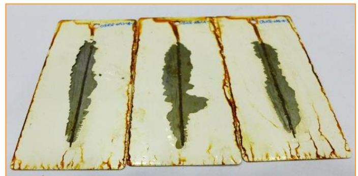
(b) Aspecto general del conjunto de muestras, detalle zona de incisión después de delaminación, una vez finalizado el ensayo.