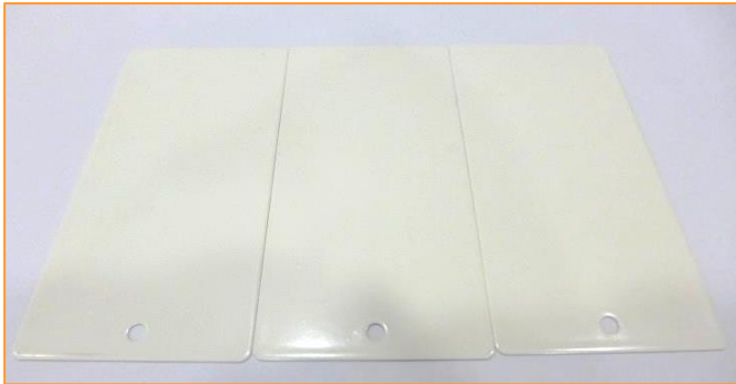
(a) Aspecto general del conjunto de muestras (estado de recepción en laboratorio).