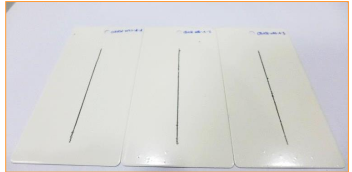
(b) Aspecto general del conjunto de muestras, una vez realizada la incisión sobre la cara pintada